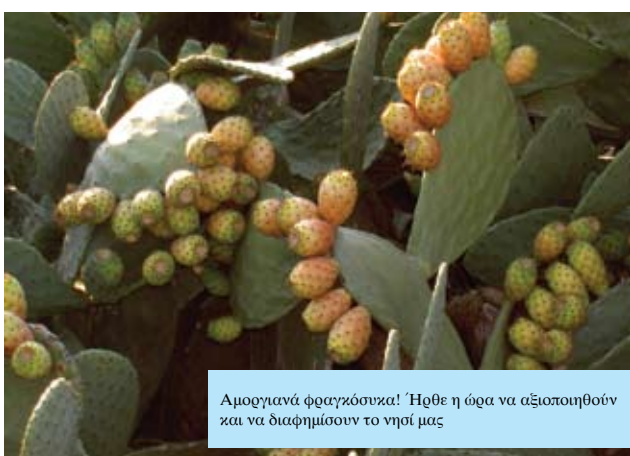
Αμοργιανά φραγκόδσκα! Ήρθε η ώρα να αξιοποιηθούν και να διαφημισούν το νησί μας