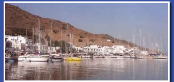
Τα ιστιοπλοϊκά σκάφη που έλαβαν μέρος στον αγώνα REGATA στο λιμάνι των Καταπόλων