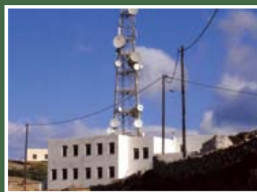
Η δολοφονική κεραιά δίπλα από το σχολείο της Χώρας