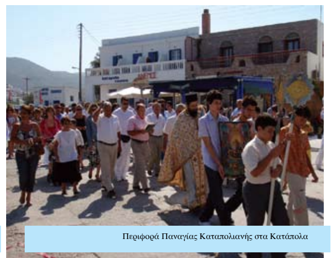
Περιφορά Παναγίας Καταπολιανής στα Κατάπολα