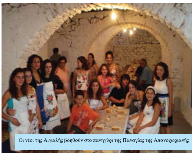
Οι νέοι της Αιγιάλης βοηθούν στο πανηγύρι της Παναγίας της Απαντοχοριανής