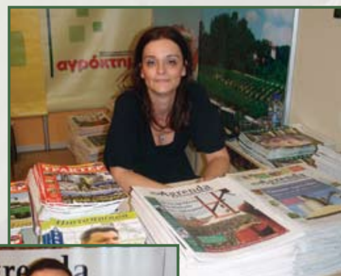
Η αρχισυντάκτης της εφημερίδας ΑΓΡΕΝΤΑ